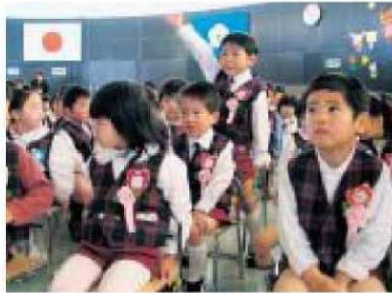
【写真右・保原合同入 園式】先生に名前を呼 ばれ、元気良く返事す る園児