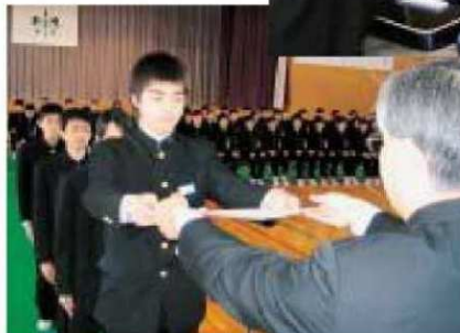
緊張した面持ちで卒業 証書を受け取る卒業生 【写真上・小手小学校】 【写真左・伊達中学校】