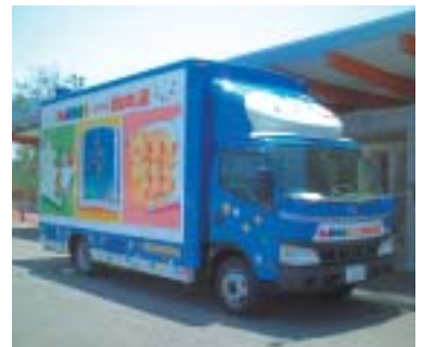
約500冊の児童書を積んだキャラバンカー