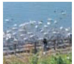
阿武隈川 五十沢水辺の小築

◆応募資格と募集人員 担当区間に通うことができる20歳以上の健康で河川に関心のある方(1人)。