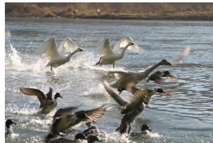
▲阿武隈川 五十沢の白鳥