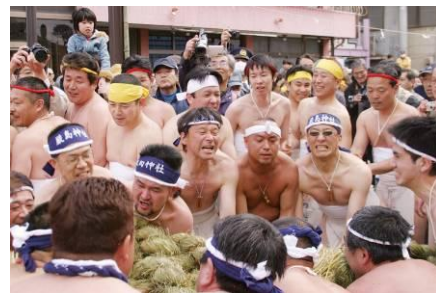
▲奇祭 つつこ引き祭り