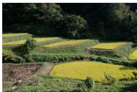
▲手入れが行き届いた棚田