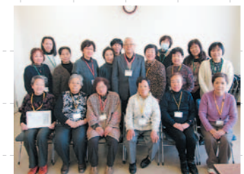
〈梁川教室の皆さん〉 毎週の教室で、仲間と楽しい会話と学習を楽しんでいます。

簡単な読み書き・計算を行い、脳のトレーニングを行っています。脳の前頭前野という部分の血流が良くなり集中力が高まります。