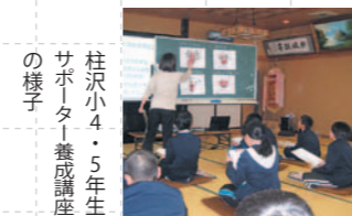
柱沢小4・5年生サポーター養成講座の様子

認知症を正しく理解し、認知症の人やその家族を支える「認知症サポーター」を養成しています。伊達市には、5408人のサポーターがいます。(12月末現在)