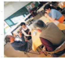
大田地区交流館でのカフェの様子

認知症の人やその家族、専門職などが集まり、気軽に交流を図ることができるカフェです。各地域で開催しています。