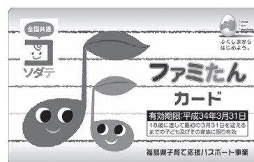
新デザインのファミたんカード

福島県内の利用に限り平成32年3月末まで有効となりますが、今お持ちのカードでは、平成29年4月から他の都道府県では使用できなくなります。早めの更新をお願いします。