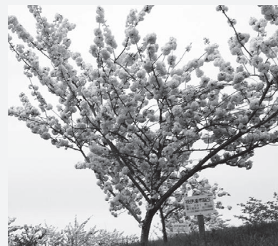
里子となっている桜のそばに立てられたプレート

【申込方法】 申込用紙(※)またはハガキ、メール、FAX に以下の情報を明記し保原総合支所へお申し込みください。