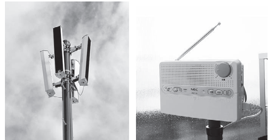
屋外拡声機と個別受信機

市民の皆さんに緊急情報や災害情報などを迅速に伝達できる「同報系防災行政無線」の運用を4月1日から開始しました。市内各所に整備した屋外拡声機と指定避難所や福祉施設などの屋内に設置した戸別受信機から放送されます。