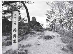
伊達氏発祥の地 高子岡城跡に位置する 丹露盤(たんのろばん)

江 戸時代に熊 はりよう 阪 はりよう 霸陵によって漢詩が詠まれた景勝地である高子二十境を歩いて巡りながら、県の無形民俗文化財に指定されている箱崎の獅子舞を見に行きませんか。各地で詠まれた詩をガイドが解説しますので、初めての人もお気軽にご参加ください。