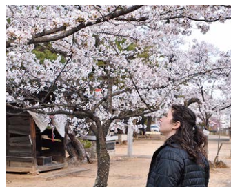
美しい桜を楽しみました I enjoyed the beautiful cherry blossoms.