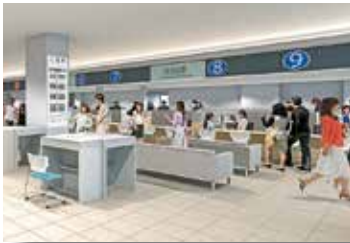
増築庁舎の内観イメージ

市民にとって分かりやすく便利な窓口とするため、各種申請や手続き、相談などの業務が多い部署を関連の