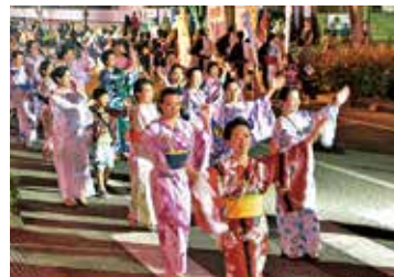
ほばらサマーフェスティバル

これまで刊行された絵本の構想から完成するまでの逸話もあり、参加者は熱心に聞き入っていました。