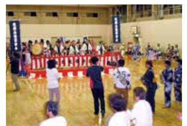
小手姫の里夏まつり

8月16日は月館小学校をメイン会場に、小手姫の里夏まつりが開催されました。恒例の盆踊りは体育館での開催となりましたが、校庭には露店が並び、多くの人でにぎわいました。