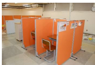
個別学習スペース