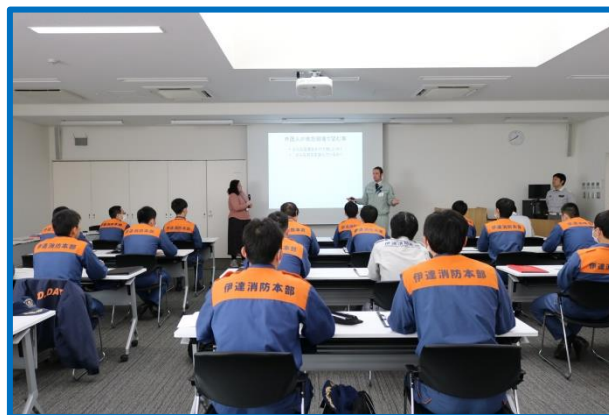
外国人対応救急活動訓練