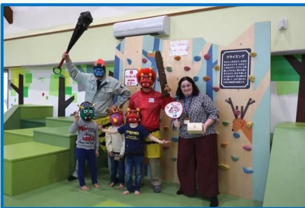
ファミリーパークだてで豆撒き