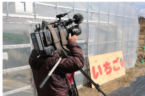
道の駅伊達の郷りょうぜんのいちご園