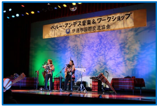
ペルー・アンデス音楽&ワークショップ