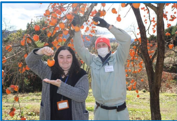
あんぼ柿を作ります (Part 1)