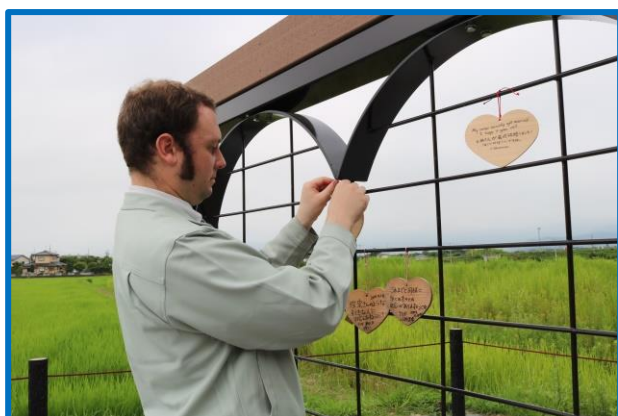
梁川町のハート型モニュメント