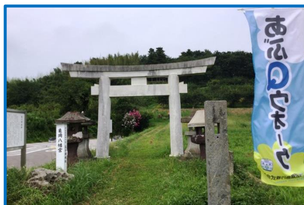
あぶQウォーク高子