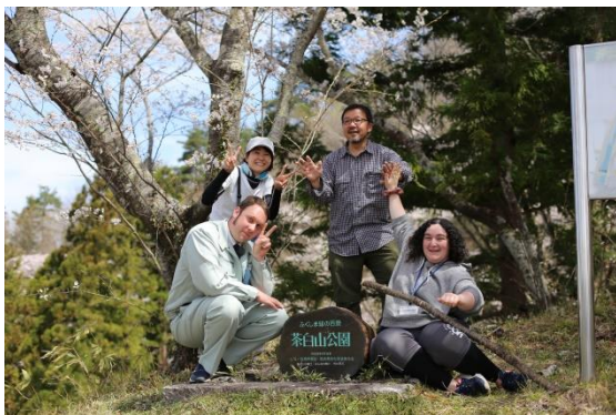
伊達の桜巡りシリーズ