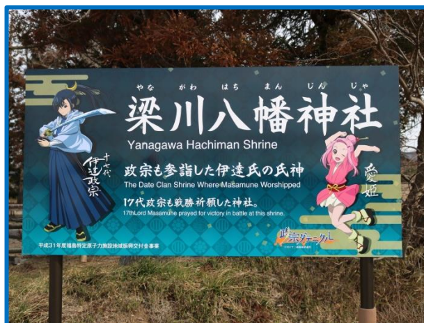
梁川八幡神社にある看板