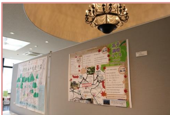
梁川美術館に展示されました 高子ガイドマップ