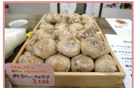
日本一のおにぎり