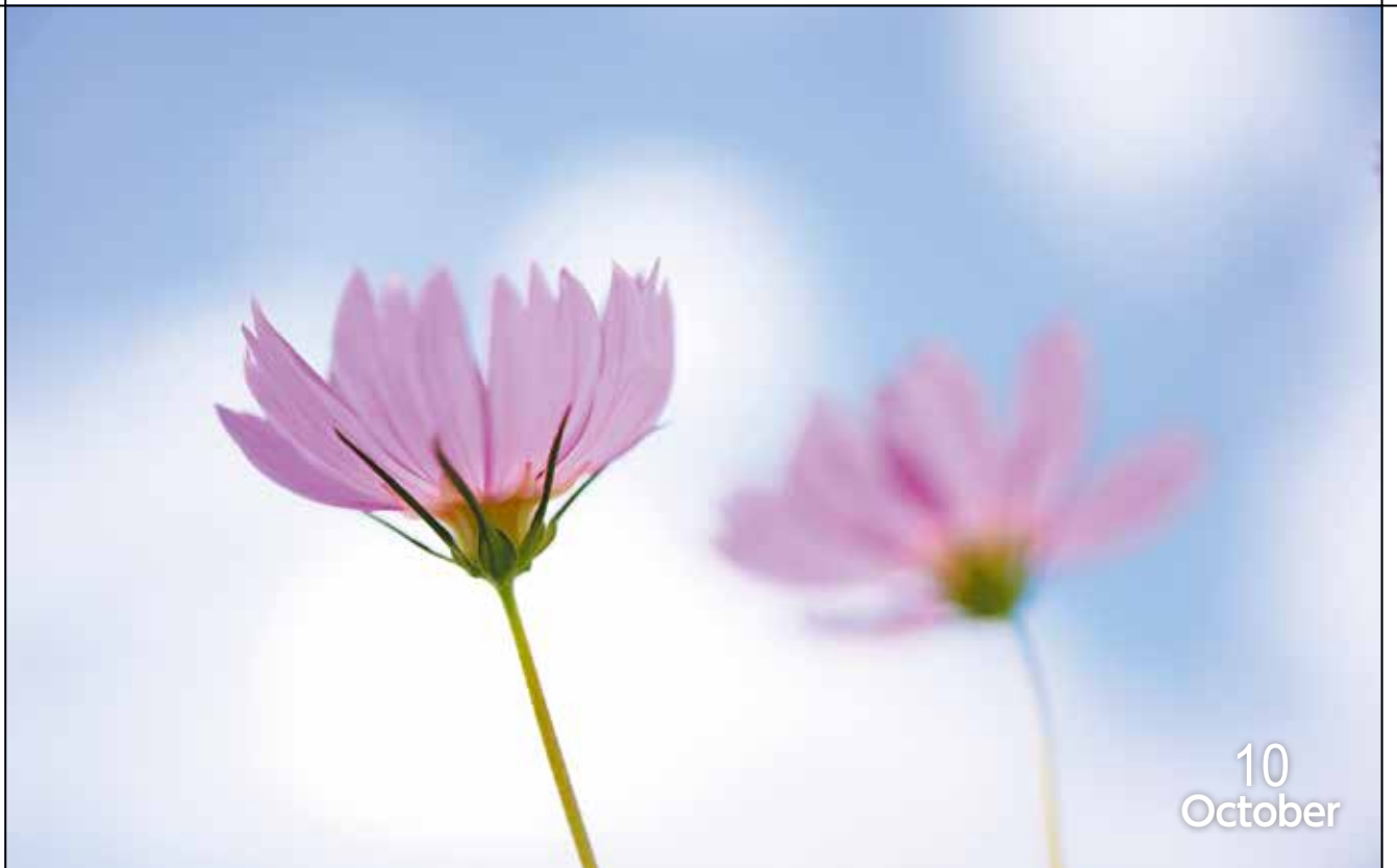
優しい秋（梁川町広瀬川河川敷）