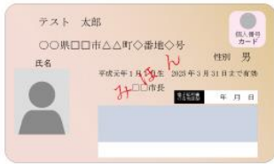
(表面) 個人番号カード (裏面)