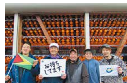
あんぼ柿生産者からのエール

伊 達市はガイアナ共和国のオリンピックピック・パラリンピック復興ありがとうホストタウンで、今年開催予定のオリンピック・パラリンピック東京2020大会後にガイアナ共和国関係者が伊達市を訪問する予定です。復興ありがとうホストタウンの取り組みとして、ガイアナ共和国に対し東日本