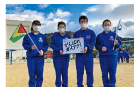
月舘学園中学校の生徒からのエール

大震災時の復興支援への感謝とオリンピック・パラリンピック大会へ向けた応援の気持ちを伝える映像を制作しました。撮影には多くの市民の皆さまにご協力いただきました。制作した映像は伊達市公式YouTubeチャンネルに掲載しています。ぜひご覧ください。