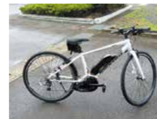
電動クロスバイク