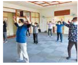
体験できる出前講座を実施中。お気軽にお問い合わせを。

元気づくり会「集会所コース」の実施を希望する町内会を募集しています。「集会所コース」は集会所などで指導員と一緒に楽しく身体を動かします。 ●実施期間と回数：6か月間、週2回(またはの組合せ) ●実施時間：10時～11時30分、または14時～15時30分(1回あたり90分程度) ●無料(会場使用に伴う光熱費などは町内会負担) ●まず健康都市づくり課にお問い合わせください。 問 健康都市づくり課 元気づくり係 575 1148