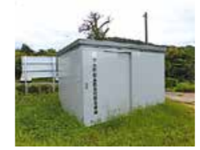
下大石自主防災会では防災倉庫を整備した

(一財)自治総合センターでは、宝くじの収益を財源として、地域コミュニティ活動の充実につながる事業を助成しています。要望は随時受け付けています。助成を希望する団体はお問い合わせください。 令和3年度は荒野町内会の集会所新築、東町町内会のコミュニティ活動備品整備、下大石自主防災会の防災備品倉庫の整備に対する助成が決定しました。 問 協働まちづくり課 地域振興係 575 2115