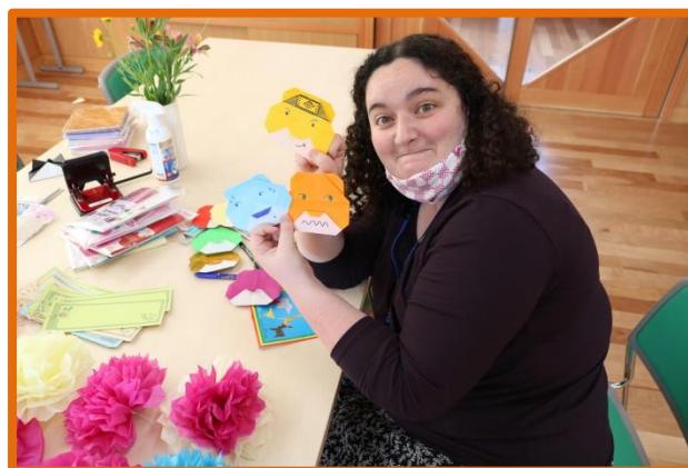
月舘学園一日活動