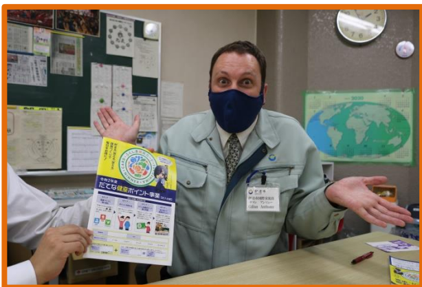
だてな健幸ポイント事業