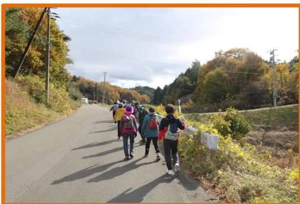
霊山でいきいきウォーキング