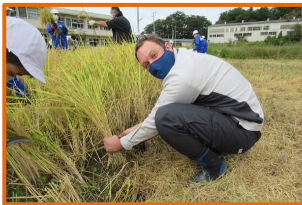
月舘学園で稲刈り