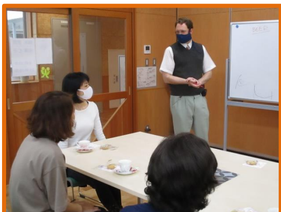
月舘学園 SC センターの英会話講座