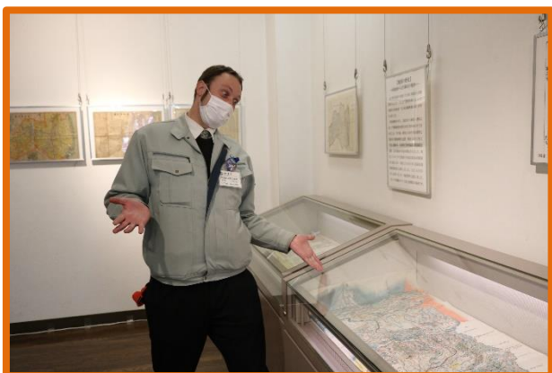
旧保原町の絵図と地図