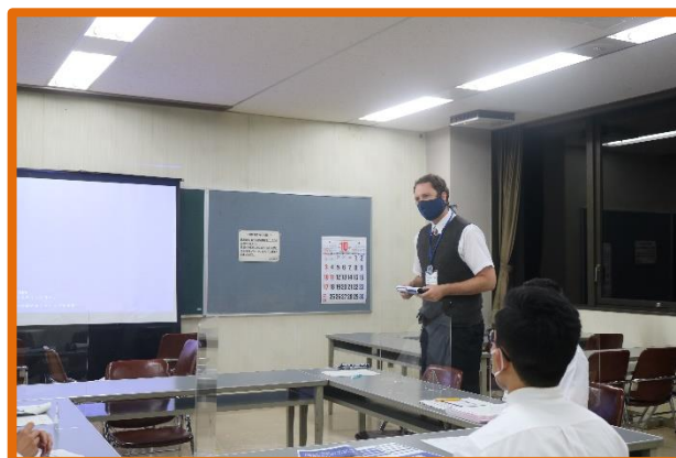
魅カアップセミナー