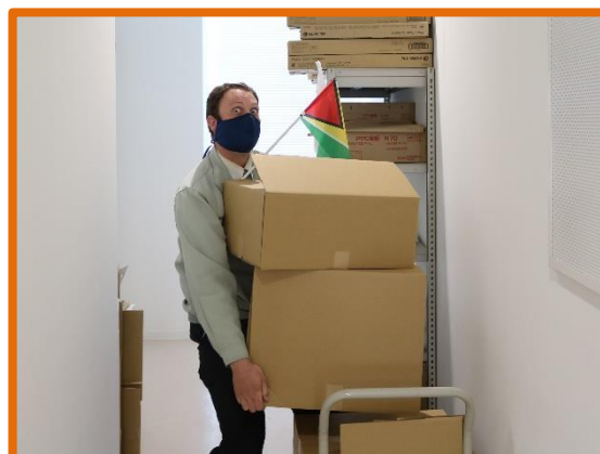
ガイアナ代表団への贈物