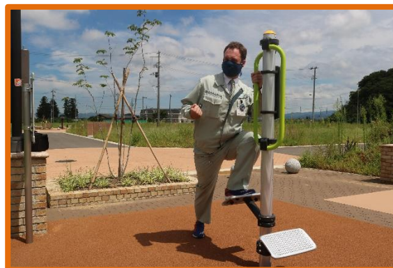
高子駅北地区で散歩