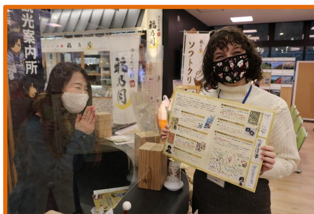
伊達市ぐるっとパスポート