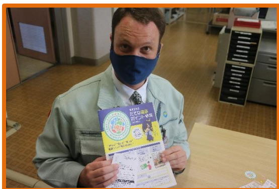
黄金健民カード受章