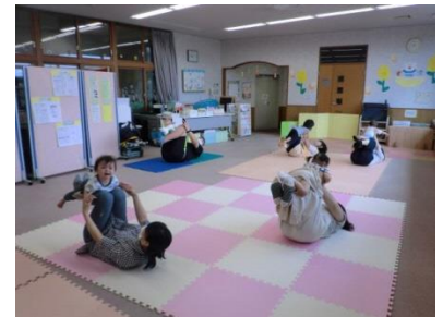
～大内先生親子運動遊び～

*お子さんのことばやコミュニケーションの育ちを促すような毎日のかかわりについて* (中川信子先生の著書より)