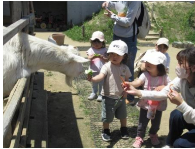
～やぎとのふれあい～