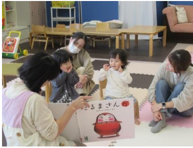
～絵本の読み聞かせ～