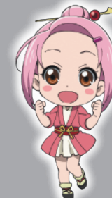
△伊達市キャラクター「正室の愛姫」 ©ガイナ/福島県伊達市 政宗データニクル