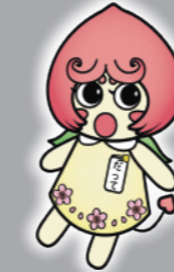
△伊達市キャラクター「だつてちゃん」