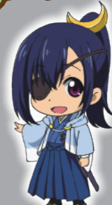
△伊達市キャラクター「第17代伊達政宗」 ©ガイナ/福島県伊達市 政宗データニクル