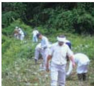
写真左：地区民総出の草刈り作業