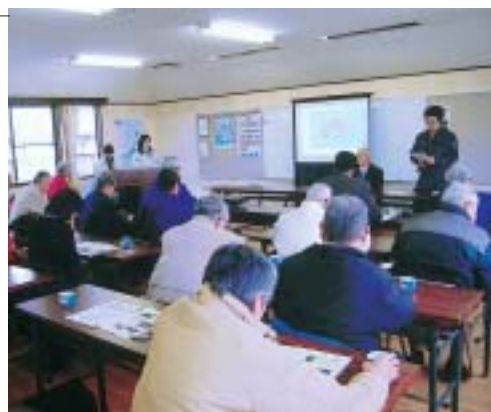
写真右：いわき市への視察研修