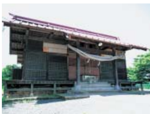
愛宕山の山頂に建つ「愛宕神社」

地域に残る歴史・伝統や自然をもつ一度再発見し、今後に伝えていかなければなりません。三町内会が一体となり、町内会の皆さんのご協力をいただき交流を