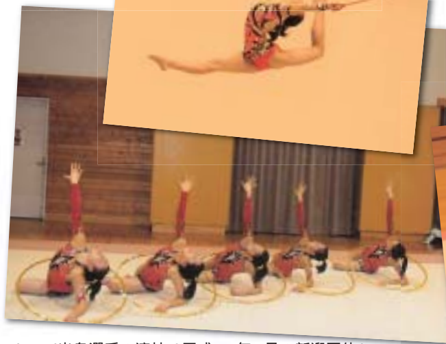
Jewel出身選手の演技(平成21年9月の新潟国体)