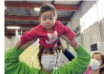
親子ふれあい体操