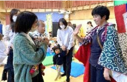
劇団「風の子」鑑賞会