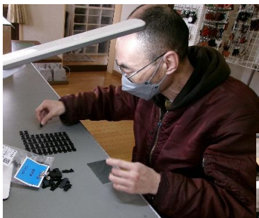
・内職：バリをとっています

9:00 開所 9:30 ミーティング 9:40 作業 10:40 休憩 11:00 ラジオ体操・作業 12:00 昼休み 13:00 作業 14:00 清掃 14:10 フリータイム 17:00 終了