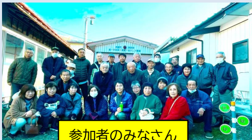
参加者のみなさん