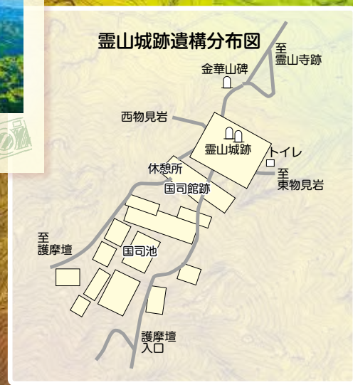
霊山城跡遺構分布図