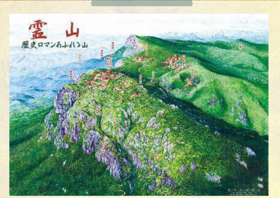
霊山寺(霊山城)復元イメージ