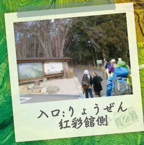
入口:りょうぜん 紅彩館側