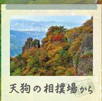
天狗の相撲場から