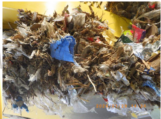
保管されていた燃料