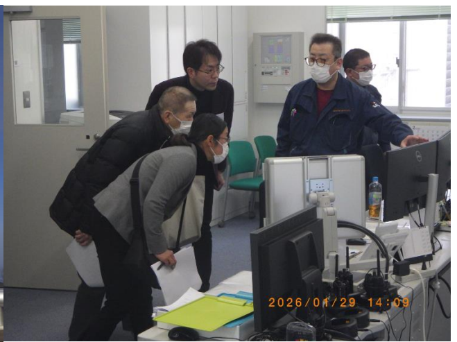
監視システムの確認