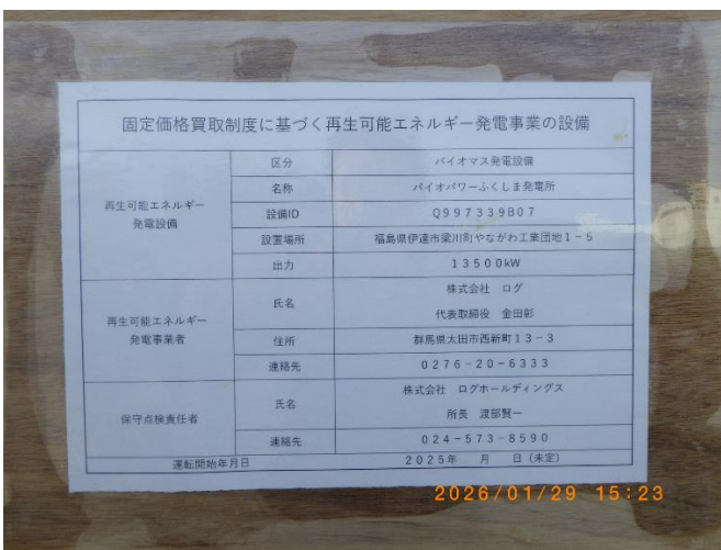
再エネ法に基づく標識