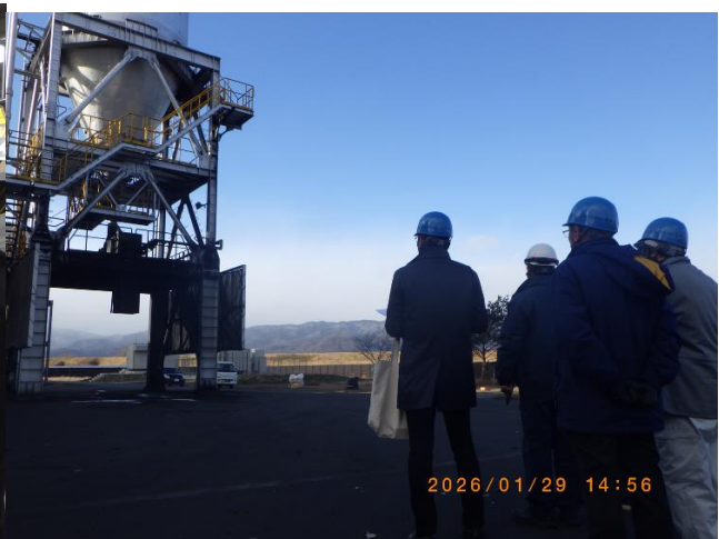
ばいじん排出装置