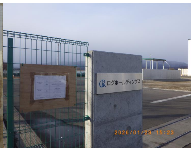
正門に掲示されている標識