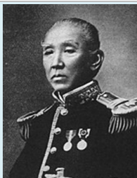
たちばな たねゆき 立花 種恭 (1836～1905)

種恭は、下手渡藩(伊達市月館町)を63年間治めた立花家の第3代藩主であり、江戸幕府最後の老中格を務めました。