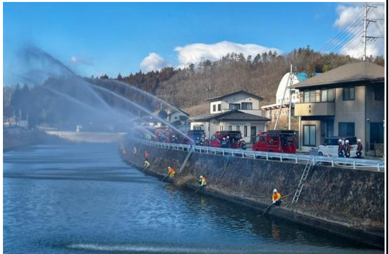
【広瀬川愛宕堰 月館支団送水試験の様子】

火災や災害は、どれほど注意していても突如として発生することがあります。その際に迅速かつ的確に対応できるよう、現場を想定した実践的な訓練を行い、地域の安全を守る準備を整えています。また、地域住民の皆様との連携も極めて重要で、防火・防災意識の向上のための啓発活動などを通じて、地域全体で力を合わせ、安全で安心なまちづくりを目指していきたいと思っております。引き続き、皆様のご理解とご協力をよろしくお願いいたします。