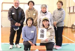
つきだての優勝チーム