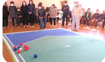
御代田の体験会の様子