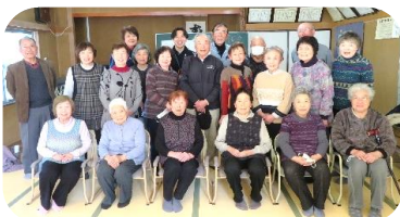
御代田天寿会の皆さん

2月1日は糠田地域振興会、2月15日はつきだて振興会、2月22日は御代田自治会、御代田天寿会は3月7日に実施しました。社協の出前講座として気軽に体験できるのも魅力の一つのようです。ゲームが進むにつれ対戦の戦略を相談しあう場面もありました。社協からは道具のみの貸出もあるので、いつでも気軽に声を掛けて下さい、ということでした。