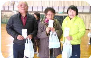
糠田の優勝チーム