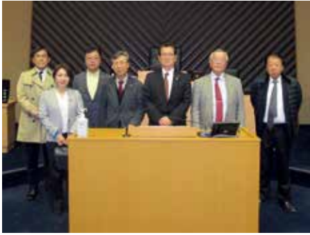
愛媛県松山市議会議場にて

令和8年1月14日から16日の3日間の日程で、宇和島市、松山市、総務省にて関係人口の創出による地域コミュニティの創生に資することを目的として視察研修を行いました。