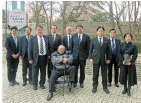
栃木県宇都宮市役所にて

令和8年1月28日から29日の日程で、埼玉県所沢市議会、栃木県宇都宮市議会の視察を行いました。今回の視察は今後の伊達市議会の議会運営について、具体的な取組の現状を伺いました。まずは質問のあり方について、①代表質問を行っているか、②一般質問の通告の時期・質問者数・答弁時間、③執行部との答弁調整はあるか、④一般質問が議案に重なる場合の対応、⑤質問テーマが重複した場合の調整、⑥再質問の回数制限、⑦通告外の質問の禁止、⑧質問時の関連資料の使用規制、⑨質問について、⑩通告後の関連質問の許容範囲の規制、議長の裁量、⑪傍聴の行い方、ルール、傍聴者数、⑫定例会の市民への公開方法についての現状を伺う。所沢市議会では代表質問は以前はあったが、一般質問との違い