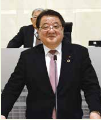
私たちは4月26日に投票の「伊達市議会議員選挙」におきまして、市民

した。 選挙期間中、気候変動による大災害の頻発化から市民の命と暮らしを守るための安全の確保と、危機管理体制の充実と強化をはじめ、子育て支援の1層の充実、若者の働く場所の確保と移住・定住の促進、高齢化対策や福祉事業の充実、中山間地に暮らす方々向けの施策、そして、道路やインフラの整備等の要望をいただきました。私たち議会は、その声に真摯に向き合っていかなければならないと決意いたしました。