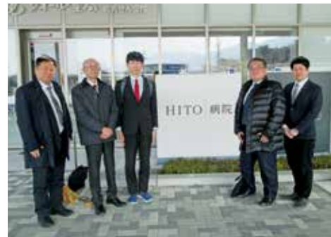
HITO 病院（愛媛県四国中央市）にて

それによって、移動距離や承認待ち時間等の削減が図られることはもとより、コミュニケーションの足かせが外れることで現場からの前向きな