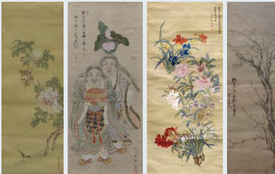
上(左から)蠣崎波響「牡丹」(個人蔵)II、大橋波練「和合二仙図(寒山・拾得)」(個人蔵)I、熊坂適山「百花図」(伊達市蔵)II、熊坂蘭斎「梅」(伊達市蔵)I 下 蠣崎波響筆「梁川八景図」複製(伊達市蔵)I・II ※所蔵者名横の「I・II」の記号は展示会期です。また、展示内容は都合により変更になる場合があります。

江戸時代後半の文化4年(1807)~文政4年(1821)年の14年間、国替えとなった松前藩(北海道)の藩士らは梁川で暮らしていました。その中には画人・かきさきはきょう 蠣崎波響(1764~1826)もあり、藩の家老職として多忙な日々を過ごす一方、財政を支えることも兼ねて作品制作を行っていました。近隣からは波響を師として門人が集い、その一人である保原出身の熊坂適山もまた、のちに信達地方を中心に多くの門人を抱える画人となりました。