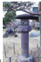
波響が天神社に奉納した石灯籠