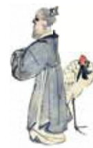
蠣崎波響「折鶴成就奉納」(部分)

松前藩が梁川に移封となった頃の蠣崎波響の作品や周囲への影響はどのようなものがあつたのでしょうか。波響研究の第一人者・井上研一郎氏にお話しいただきます。