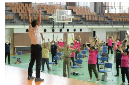
健康運動を習慣化

ICTを活用した授業及び情報教育を推進するため、GIGAスクール構想第2期において、児童・生徒一人一台タブレット端末の更新を行います。