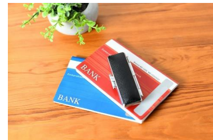
24時間口座振替申込 (イメージ)

地域おこし協力隊制度を活用し、本市の基幹産業である農業の発展や移住定住の促進、地域の活性化、シティプロモーションを図るとともに、都市部から市への移住者を増やし、新しい人材を定着させます。