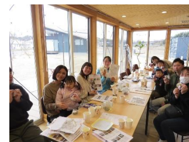
伊達市であそばね会

伊達市の魅力発掘と発信を推進し、持続的に発展し続けるまちづくりを進めるため、伊達な宣伝部長や地域おこし協力隊等との連携により、市民による地域への理解と愛着の向上を図るシティプロモーションを展開します。