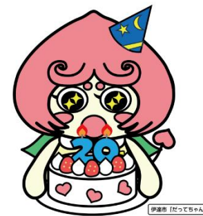
伊達市「だってちゃん」

イオンモール伊達の開業に合わせ、市のアンテナショップを設置し、市内周遊へのきっかけを創出します。また、ふくしまDCのおもてなし事業による観光コンテンツを利用し観光客を呼び込み、特に仙台市との連携事業を実施します。