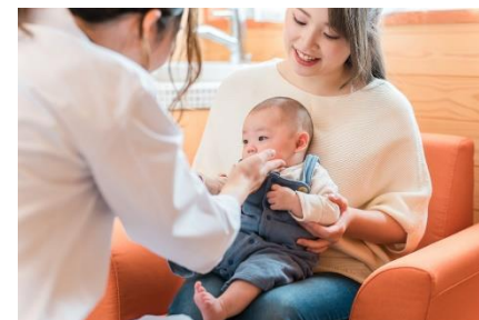
乳幼児健康診査 (イメージ)

乳幼児の健やかな成長のため、発育発達の確認と疾病の早期発見、望ましい生活習慣の確立など次世代育成に向けた健診を実施します。令和8年度から幼児の健康の保持増進を図るため、新たに5歳児健康診査を実施します。