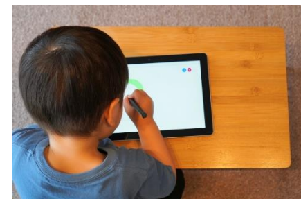
タブレット端末 (イメージ)