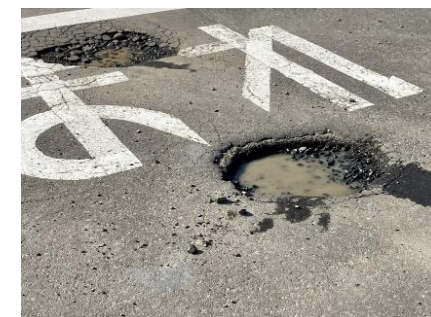
修繕が必要な道路 (イメージ)

道路ネットワークの充実を図るため、市道前川原線の現道拡幅整備を行います。令和8年度は、用地買収、物件移転補償を行います。