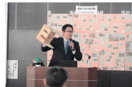
地域おこし活動報告会