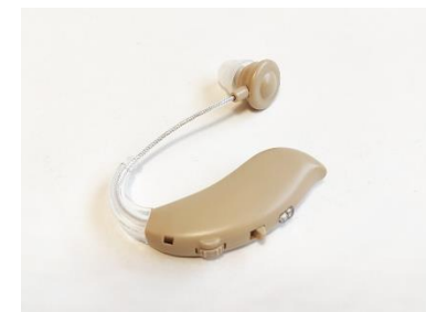
高齢者補聴器購入費を助成 (イメージ)

小学校及び中学校施設の営繕、管理業務委託、その他施設備品等の管理を行います。令和8年度からトイレの洋式化率が低い小中学校を対象に、計画的にトイレの洋式化を進めます。