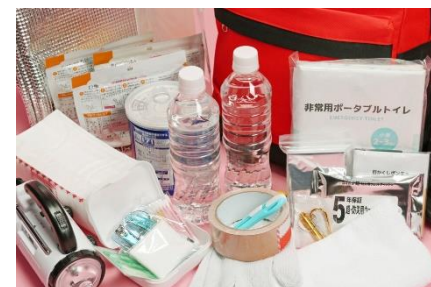
防災備蓄品 (イメージ)

住民の生命、身体及び財産を災害から保護するため、備蓄品等の購入、防災（災害）対策用資機材等の購入、運用及び維持管理を行います。