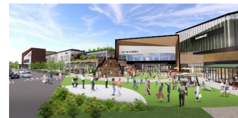
イオンモール伊達