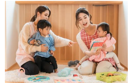
子育て環境の充実 (イメージ)

市内の雇用促進及び高齢者の就業機会の拡大と福祉の増進を図る。令和8年度は、働きやすい環境の整備の推進として、企業向けの「選ばれる企業になるための職場環境改善支援」と求職者向けの「働きやすい企業の選定支援」を実施します。