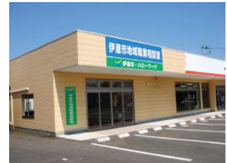
伊達市地域職業相談室