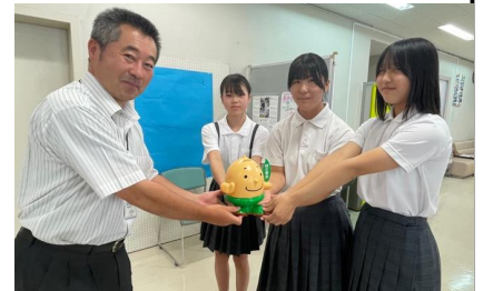
月館学園のみなさんから月館総合支所長へ募金が手渡されました

このたびご協力いただきました緑の募金は、月館地域全体で103,327円、月館学園からは9,088円が集まりました。ご協力くださった皆さま、ありがとうございました。集まった募金は、市民の皆さまへの苗木や花苗の提供など、緑化推進事業に活用いたします。