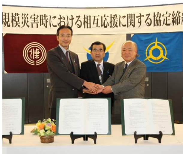
握手を交わす國定三条市長（左）、久住見附市長（右）と仁志田市長

各市長は、「三市の連携が深まるように尽力していきたい」（國定三条市長）、「いざという時に助け合える仲間、日頃から交流できる仲間がいることはとても心強い」（久住見附市長）、「これからもさまざまな場面で交流をし、絆を深めていきたい」（橋川草津市長）とそれぞれ期待を述べました。