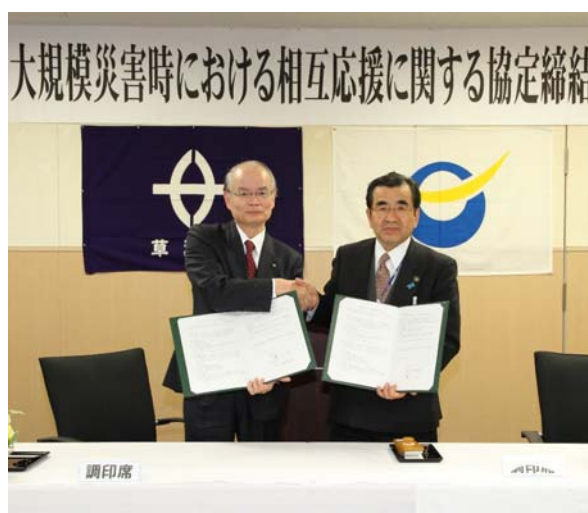
協定書を取り交わす橋川草津市長と仁志田市長